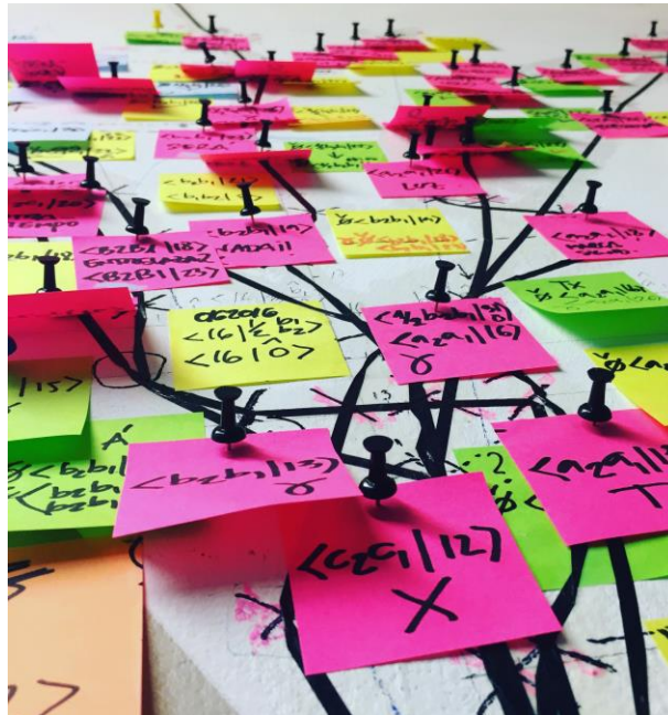
{ \emptyset } Mapa_plano. Detalle, 2016-17

Todo el proyecto versa sobre el cuestionamiento de la idea de conjunto vacío en tanto que receptáculo o reservorio de tal supuesto vacío y de la unicidad del mismo.