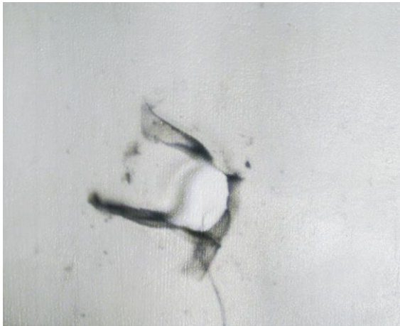
{∅} Proyección. Frame, 2016-17