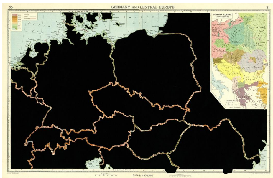
GERMANY AND CENTRAL EUROPE. Serie: The Comparative Atlas . London 1948. Páginas de libros recortadas. 42,7 x 27,7 cm. 2017.

Hay tantos mapas como representaciones del mundo. Cuando en el siglo XVIII el pensamiento humano comenzó a concebir el territorio desde los dominios de la ciencia, la cartografía, en términos generales, dimensionó la Tierra en función de lo medible y cuantificable. La dividió. A partir de una serie de líneas trazó las fronteras que fragmentan la superficie y distinguen a un espacio del otro. Cuando observamos un atlas, por ejemplo, lo que solemos ver son esos planos gráficos. Y sí, la cartografía es ciencia, pero los mapas son dibujos.