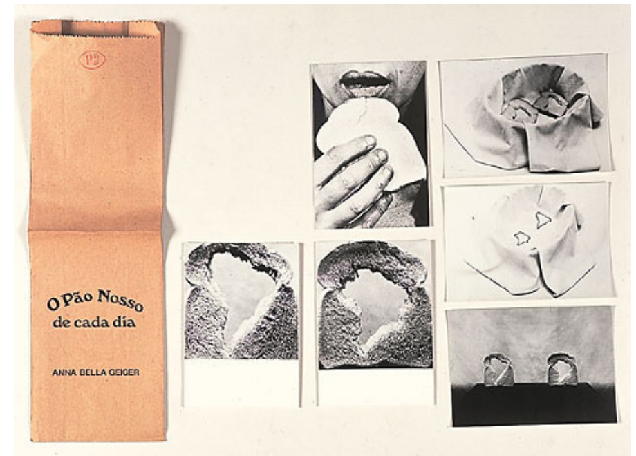
Anna Bella Geigero O Pao Nosso Our Daily Bread, 1978 | Original photographic postcards, silkscreen, paper bag | Edition of 5 36 × 60 cm | Original