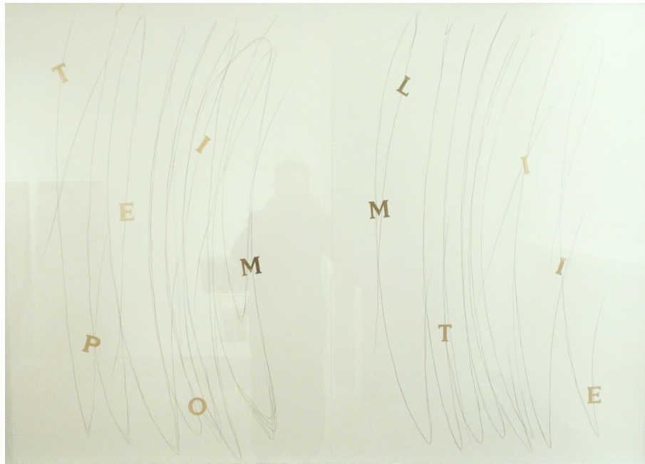
Concha Jerez Serie Música diaria. Tiempo límite, 2009 | Collage y grafito sobre papel | 112 × 152 cm | Original